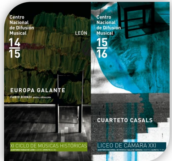
PROGRAMAS DE MANO del CENTRO NACIONAL DE DIFUSIÓN MUSICAL (CNDM)